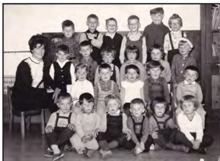
Začátky v kunvaldské školce

Ve dvaceti letech jsem si mohla vybrat ze tří MŠ, kde budu pokračovat. Přijala jsem nabídku do Kunvaldu na místo ředitelky. V tomto roce jsem se taky vdala.