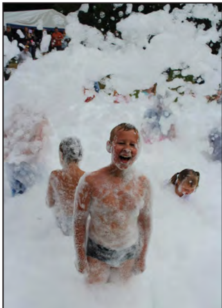
Hurá do pěny...!

vají sousedé, přátelé i celé rodiny a lidé až opravdu z daleka.