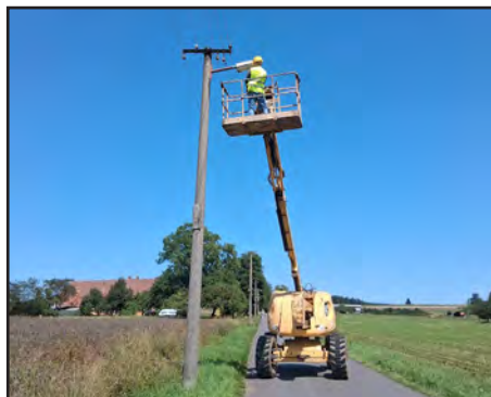
Výměna osvětlení na Končinách

V srpnu proběhla výměna světel na Končinách, při které se staré lampy měnily za nové - úsporné. Na tuto výměnu jsme čerpali dotaci z Pardubického kraje ve výši 140.000 Kč.