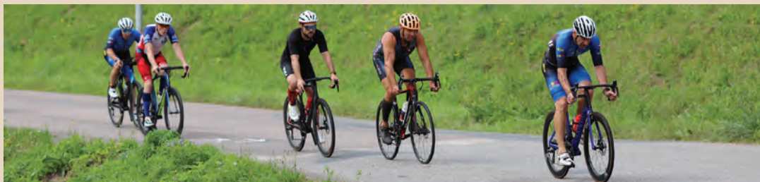
Kunvaldský Železný muž – cyklistická část