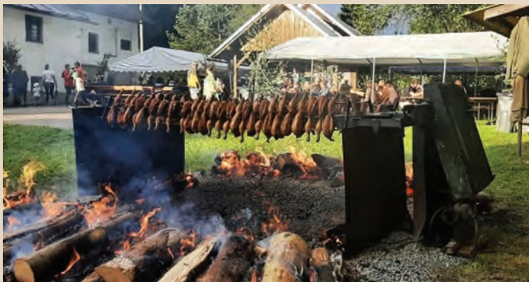
Myslivecké Loučení s létem nabízelo plno pochoutek