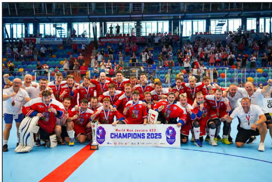
Radost z vítězství – nepopsatelná