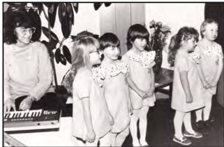
Předškolní pěvecký sbor Čtyřlístek

Co se týká výtvarných činností, na které jsi se také ptala, tak jen stručně (smích). Vyzdobila jsem celou školku pohádkovými postavami, každoročně tvořila tabla budoucím školákům, pravidelně jsem malovala pozvánky a plakáty na různé akce v Kunvaldu (plesy, besídky, výstavy), a také jsem byla u zrodu prvního plakátu a diplomu obnoveného dálkového pochodu v Kunvaldu s novým názvem „Mufloní stopou“.