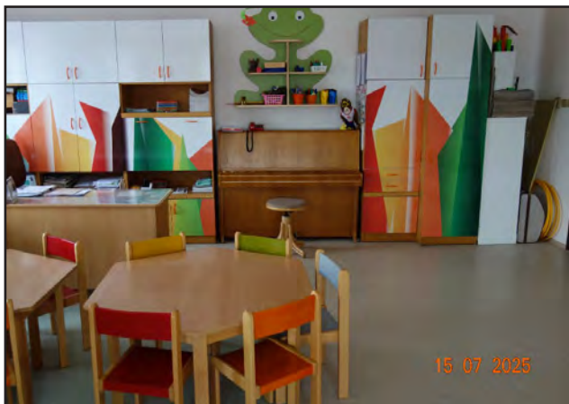
Veselá třída pro veselé děti, foto Dana Jirešová

- opakovaný pobyt v solné jeskyni v Žamberku, výuku angličtiny, cvičení v projektu Sokola „Svět nekončí za vrátky, cvičíme se zvířátky“, taneční školičku, běžecké i sjezdové lyžování, plavecký výcvik v Ústí nad Orlicí.