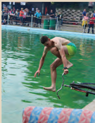
Kunvaldská lávka 2025