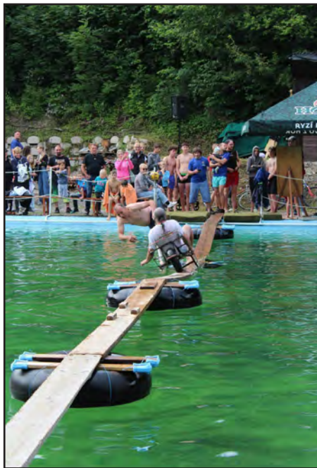
S trakařem přes koupaliště

V sobotu 12. července jsme jako hasiči uspořádali už 31. ročník Kunvaldské lávky aneb „S trakařem napříč koupalištěm“. A musím říct, že jsme si to společně s vámi užili na maximum.