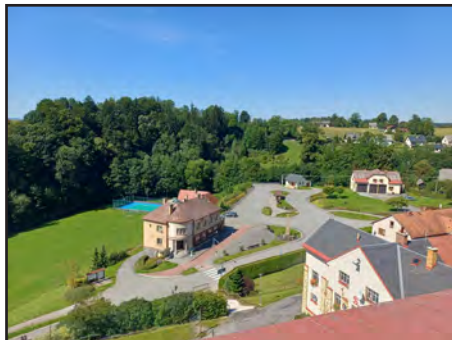
Výhled ze střechy školy na centrum městyse