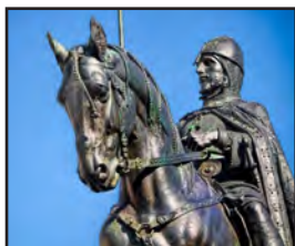
Svatý Václav, jak jej známe všichni

Ve čtvrtém roce Václavovy vlády, Jindřich I. zvaný Ptáčník oblehl Prahu a jeho vítězství bylo jasné. Václav odmítl boj a vyjednal s Jindřichem roční poplatek 500 hřiven stříbra a 120 volů. Způsob jeho mírové vlády, se znelíbil šlechticům. Domluvili se s jeho bratrem Boleslavem, který by se rád ujal trůnu, že Václava odstraní.