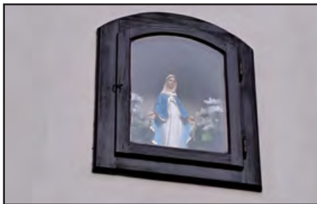
Čerstvě vysvěcená soška Panny Marie ve výklenku kapličky na dolním Kunvaldě