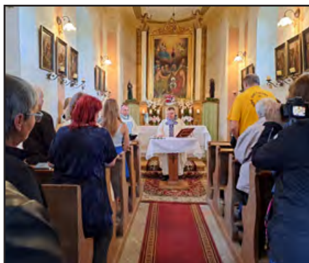
Z poutní mše na svátek Narození Panny Marie v kapličky na dolním Kunvaldě