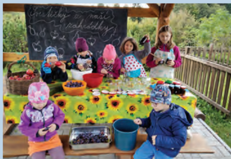
Děti z Misijního klubka připravují dárečky na Misijní neděli