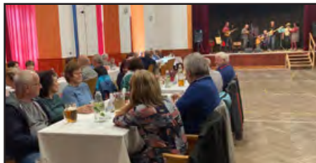
Odpoledne seniorům zpřijemnila skupina Makadam, foto Šárka Junková