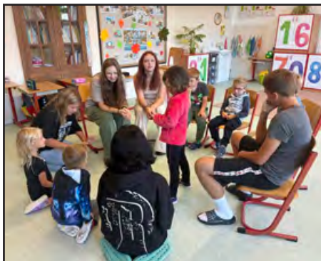
Malí a velcí školáci – spolupráce jim šla