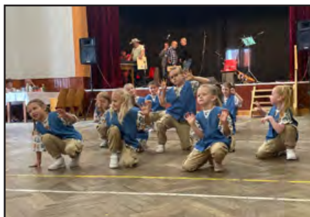
Skupina NEON ze Žamberka