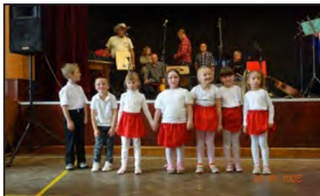
Děti z MŠ také potěšily důchodce na jejich setkání