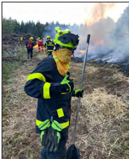
CWA – hasiči při zásahu

Druhý den byla akce „naostro“. Budíček ve čtyři ráno, sbalit vše potřebné na celý den v terénu v režimu zásahu a už před šestou hodinou skupiny vyrazily do zadaných sektorů v terénu, kde na jednotlivých