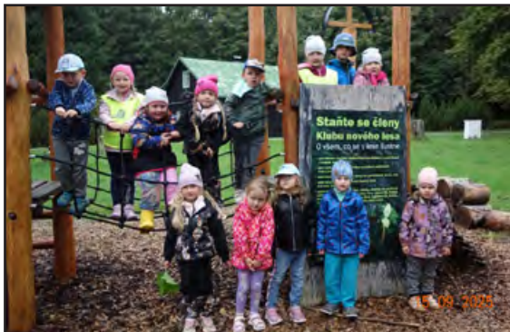
Na Dni přírody na Haničce