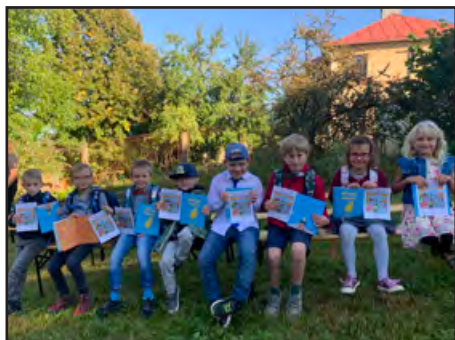
Prvňáčci při zahájení školního roku

Učebnu fyziky jsme vybavili novým nábytkem, vznikla tak učebna pro výuku přírodovědných předmětů. Počítačovou učebnu jsme vybavili novými počítači – nahradili jsme jimi již dosluhující notebooky. Nakoupili jsme také moderní pomůcky pro výuku přírodovědných předmětů a informatiky. V obou učebnách jsou nové podlahy, vybudováním bezbariérového WC jsme dokončili bezbariérovost školy. Celková cena projektu byla 2 650 000 Kč, z toho nábytek do přírodovědné učebny stál 784 000 Kč, vybavení moderními technologiemi vyšlo na 807 000 Kč a vybudování bezbariérového WC na 313 000 Kč. Projekt byl financován z fondů EU prostřednictvím IROP částkou 2 370 000 Kč.