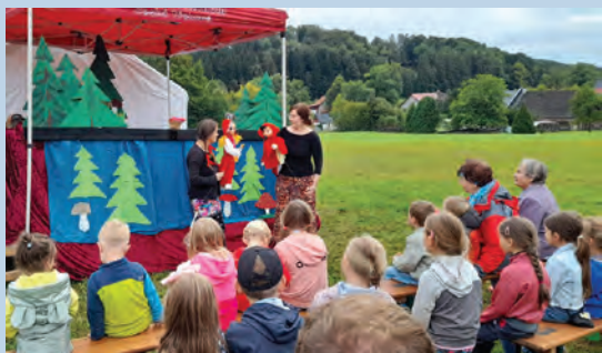
Divadlo – spolek SouSedíme