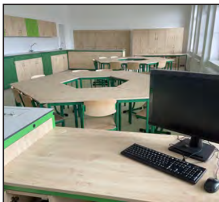
Interiér nové učebny