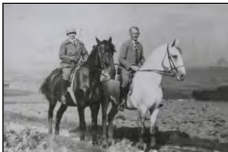
Profesor na vyjíždě v okolí Kunvaldu