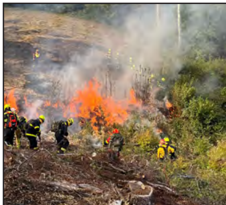
Lesní požár skutečně „není legrace“

Zúčastnit se CWA 2025 pro nás nebylo jen „další školení“. Hlavním přínosem pro naši jednotku bylo lepší pochopení chování požáru, zkušenost s modulární technikou, čtyřkolkami a ručními prostředky, zefektivnění postupů přenosu vody v členitém terénu, a hlavně nácvik kritického rozhodování pod tlakem – jak reagovat, pokud se situace změní.