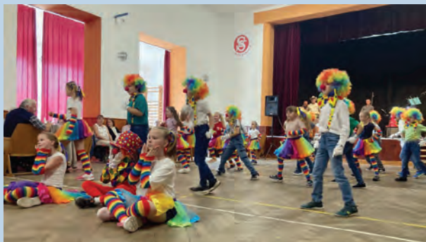
Školáci tančí pro důchodce