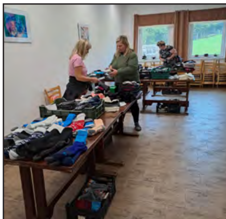
Ponožek bylo na výběr opravdu hodně a k nim i něco dobrého

V neděli 28. 9. 2025 jsme připravovali pohostění pro tradiční podzimní setkání kunvaldských důchodců konané v místní sokolovně.