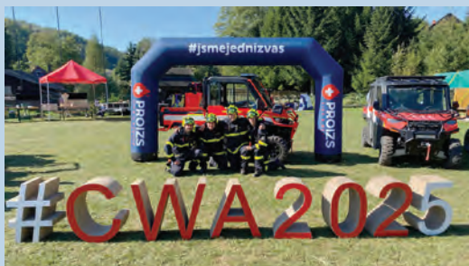
Členové zásahové jednotky hasičů byli na cvičení hašení lesních požárů