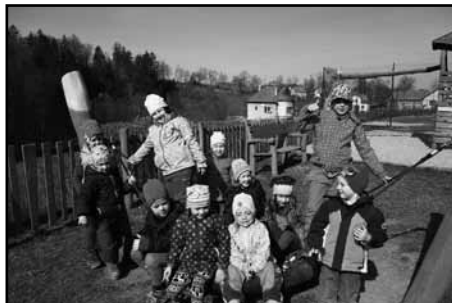
Kdo si hraje, nezlobí...

V průběhu měsíce nás stejně jako v březnu čekalo mnoho zajímavých událostí. Učili jsme se mluvit anglicky na lekcích angličtiny. Naši předškoláci navštívili prvňáčky a porozhlédli se u nich. Také jsme se učili plavat v Ústí nad Orlicí.