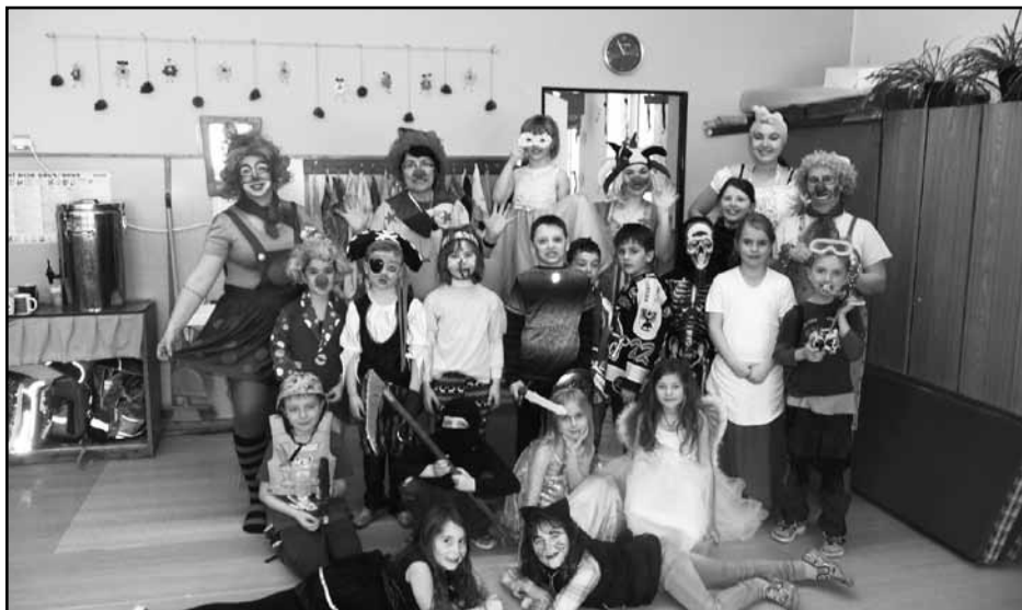
Maškarní karneval ve školní družině

naše těla dostatečně protáhla za doprovodu veselých písniček. Dále jsme pokračovali už v sedě na židličkách a snažili se nafukovat balonky, až konečně praskly (zde pomohl špendlík). Rádně vyčerpaní jsme se těšili na tombolu, ale výhry nebyly nikde vystavené.