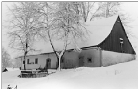
Kunvald čp. 1

Tentokrát z foto příloh – zimy v Kunvaldu – autorem fotografií vlevo je Karel Režný: