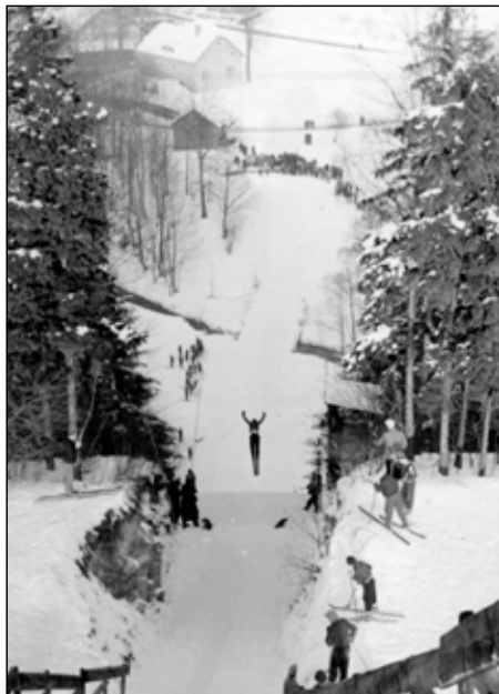
Sportování v zimě v Kunvaldu ve starých fotografiích (1950 – 1960) – skoky na lyžích