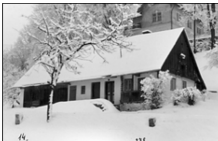
Kunvald čp. 14 a čp. 278